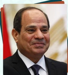
السيد الرئيس/ عبد الفتاح السيسي رئيس جمهورية مصر العربية