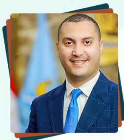
الدكتور/ عمرو البشبيشي نائب محافظ كفر الشيخ