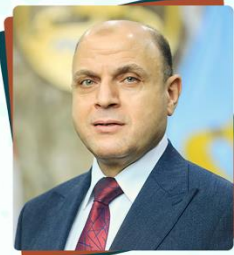
اللواء الدكتور/ علاء إبراهيم عبد المعطي محافظ كفر الشيخ