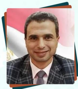
د/علاء جودة وكيل وزارة التربية والتعليم